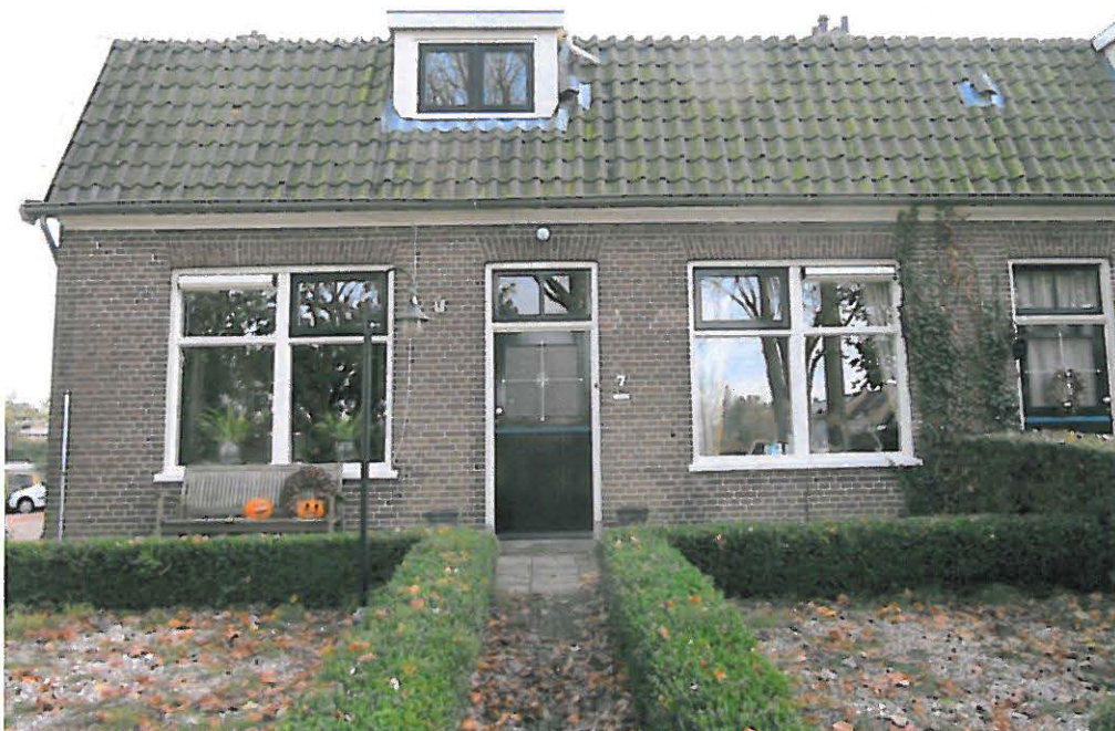
Voorgevel Lisserdijk 7