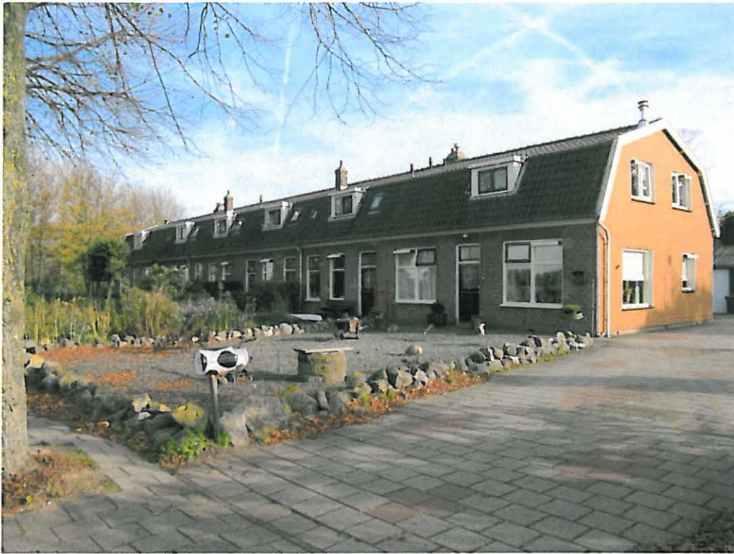
Voor- en kopgevel