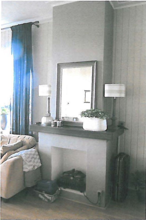
Interieur Lisserdijk 7: rookkanaal in woonkamer