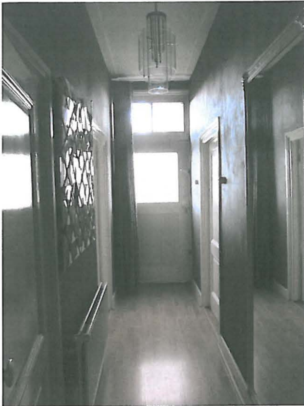
Interieur Lisserdijk 7: corridor achter entree