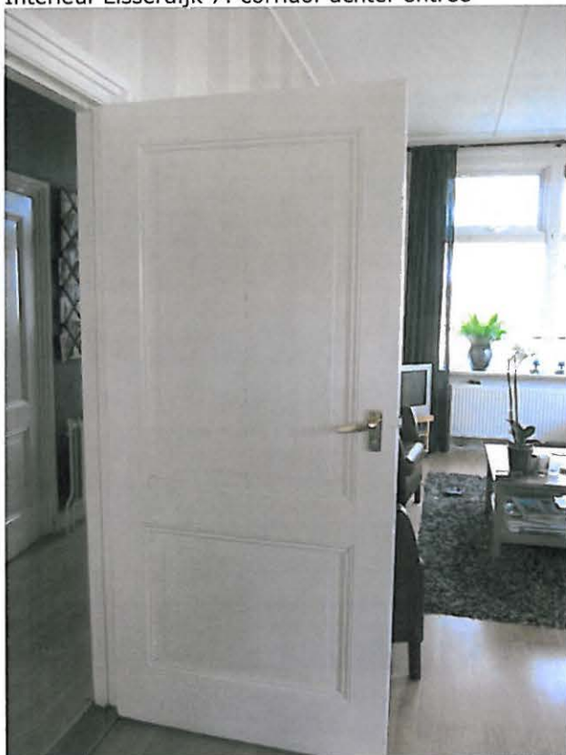
Interieur Lisserdijk 7: paneel deur