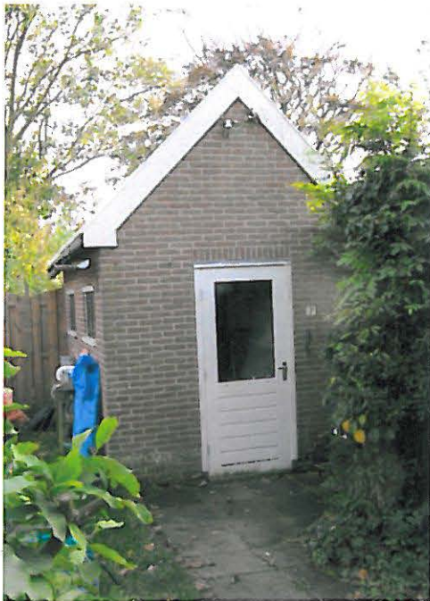
Gemetselde berging in achtertuin