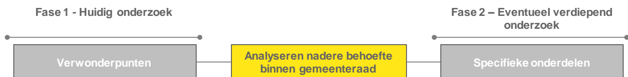
Figuur 2 - Fasegewijze aanpak

Waar normaliter in onderzoeken ten behoeve van de rekenkamercommissie sprake is van een normenkader met een uitgebreide set van toetsingscriteria om te bepalen of de gemeente het 'goed' of 'niet goed' doet, is dat voor dit onderzoek niet aan de orde. Een dergelijke beoordeling vindt niet plaats. De inventarisatie in het onderzoek schept inzicht in een onderwerp dat voor veel betrokkenen onduidelijk is. Daar waar in de inventarisatie verschillen in overhead (kwantitatief of kwaliteit) tussen de gemeenten, met behulp van de hierboven weergegeven methodiek, niet afdoende verklaard kunnen worden, leidt dit tot de formulering van verwonderpunten. Die kunnen aanleiding geven voor eventueel nader en verdiepend onderzoek in een volgende fase.