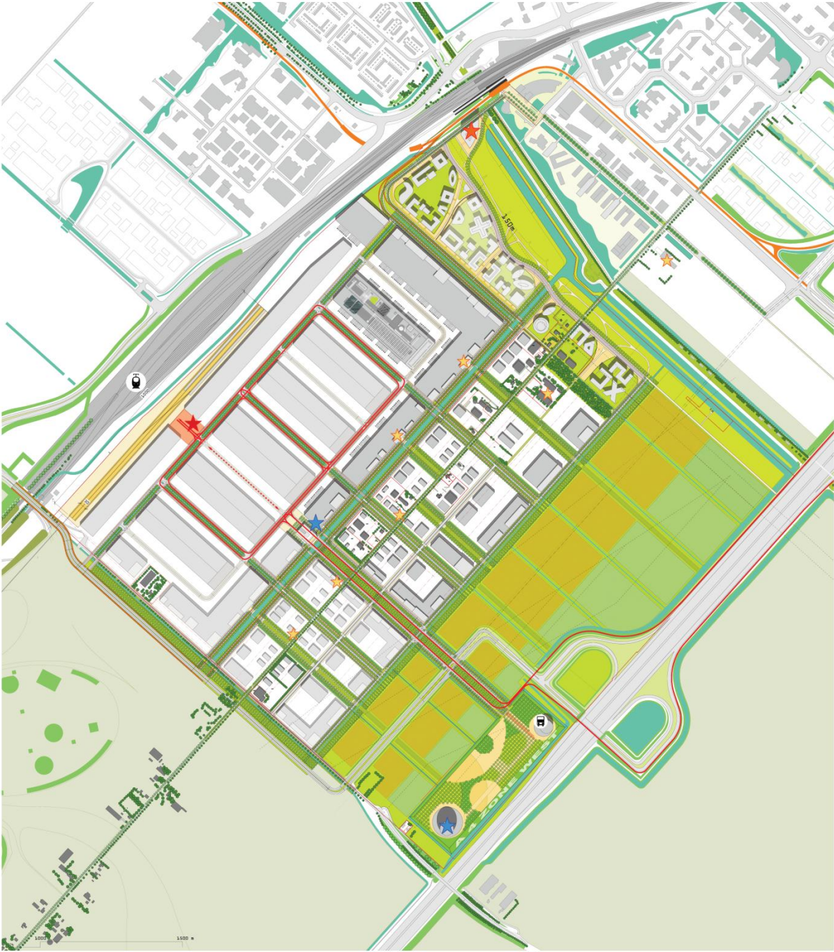
Illustratieve plankaart/proefverkaveling plangebied A4 Zone West