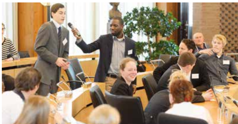
Discussie tijdens het Haarlemmermeers Scholierendebattoernooi in de Raadzaal.

scholen, inclusief een korte introductie in debatteren. Raadslid in de Klas was in 2013 op de Katholieke Scholengemeenschap Haarlemmermeer (KSH) en het Herbert Visser College (HVC). Met een aangepaste versie van Raadslid in de Klas bezochten raadsleden groep 8 van basisschool de Bosbouwer in Hoofddorp. Dat debatteren leuk en spannend kan zijn, ervaren jongeren in het jaarlijkse Haarlemmermeers Scholieren Debat Toernooi. Havo- en vwo-leerlingen van KSH, HVC, Kaj Munk College en Haarlemmermeers Lyceum kruisen in de Raadzaal de degens over actuele onderwerpen en strijden om de eer zich een jaar lang de beste debater van Haarlemmermeer te mogen noemen. Aan het Scholieren Debat Toernooi 2013 deden ongeveer 120