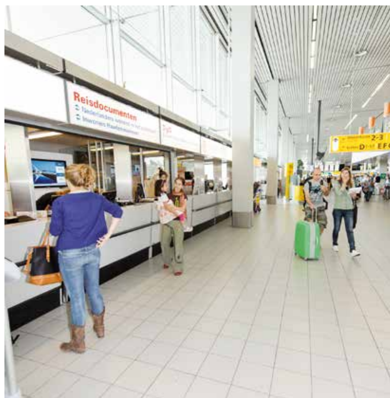
Sinds de zomer van 2013 is er een gemeentebalie op Schiphol.

beeld straatverlichting of gladheid op de weg wordt er zo snel mogelijk gereageerd. Het online team van de gemeente is via Twitter te bereiken met @Haarlemmermeer. Andere accounts van de gemeente zijn onder meer @Toezichhouders (toezichhouders en straatcoaches) en @HLMRMEER (citymarketing). De gemeente is ook actief op Facebook: www.Facebook.com/GemeenteHaarlemmermeer .