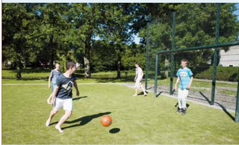
Het grote trapveld bij de Banne in Zwanenburg kreeg een kunstgrasmat.

In heel Haarlemmermeer zijn de afgelopen jaren speel-, sport- en ontmoetingsplekken aangelegd of verbeterd. Speelplekken die niet meer werden gebruikt zijn opgeheven. In alle wijken en dorpen hebben kinderen, ouders en jongeren meegepraat over de plannen voor hun buurt. Het speelruimteplan is nu klaar. Een van de laatste projecten was de aanleg van kunstgrasvelden aan de Leliestraat in Badhoevedorp, de Banne in Zwanenburg en d'Yserinckweg in Vijfhuizen.