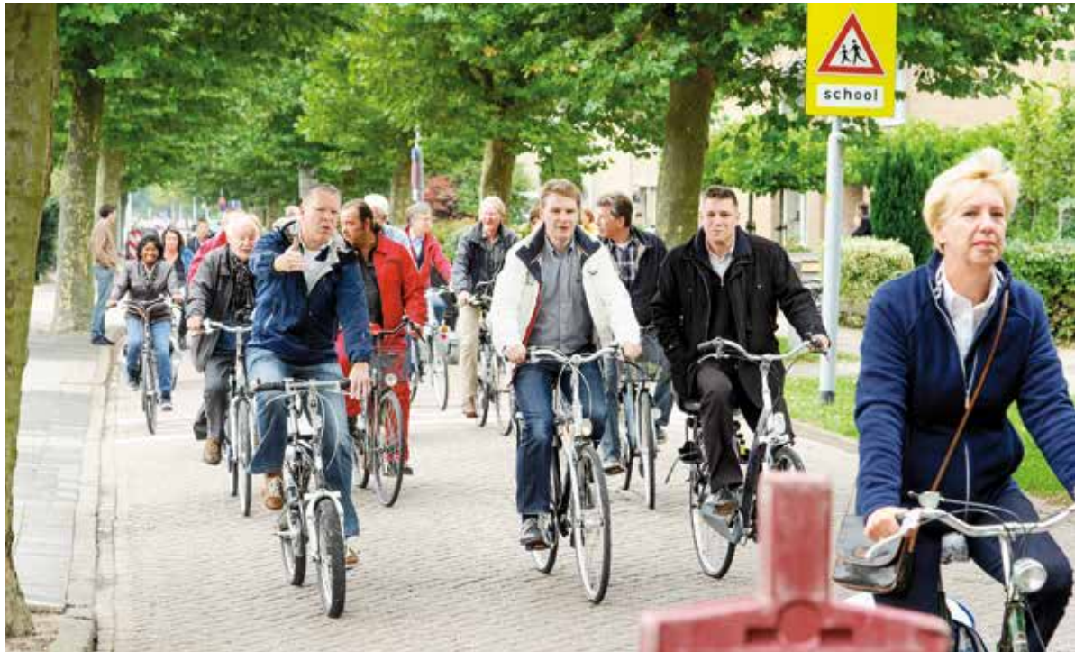
Raadsleden stapten op 21 september in Nieuw-Vennep op de fiets.