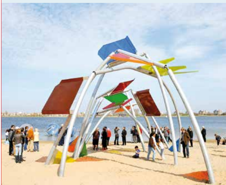
"Kunstwerk Rio is als een dier uit het water," aldus kunstenaar Dirk van Lieshout.

Het kunstwerk Rio aan de hoek IJweg/Bennebroekerweg ontwierp Dirk van Lieshout als ontmoetingsplek voor buurtbewoners en als speelplek voor kinderen. Als de zon schijnt, geven de panelen gekleurde schaduwen op het zand. De panelen van het veertien meter lange en zes meter hoge kunstwerk bieden ook bescherming tegen de zon en regen. Groot, vrolijk en gekleurd, nodigt Rio mensen uit om hun fantasie de vrije loop te laten, aldus de kunstenaar.