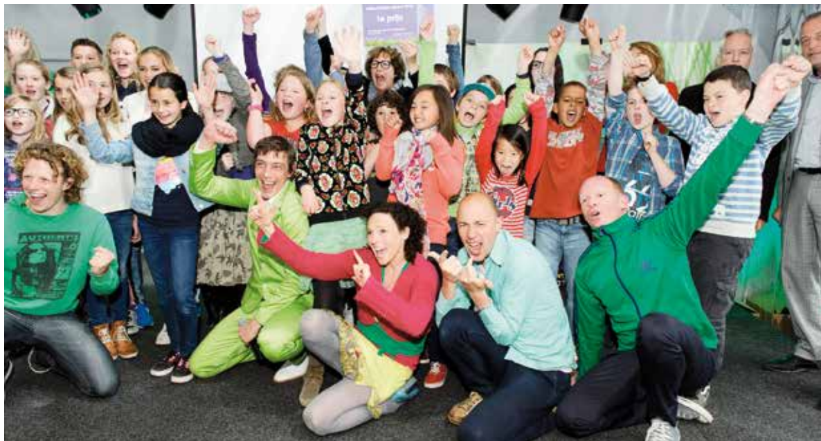
De Eerste Montessorischool uit Hoofddorp won de Milieu Helden Award 2013.

bespaard. De Dag van de Duurzaamheid op 10 oktober was in Haarlemmermeer uitgebreid tot een hele week met veel duurzaamheidsactiviteiten. Vijf 'young reporters' van het Herbert Visser College maakten hiervan een film die vertoond werd tijdens de grote slotmanifestatie in het Haarlemmermeer Lyceum. De gemeente stimuleert duurzaamheidsprojecten op scholen. Het Natuur en Milieu Centrum Haarlemmermeer (NMCH) speelt hierin een belangrijke rol. Het NMCH doet veel educatieve projecten over duurzaamheid.