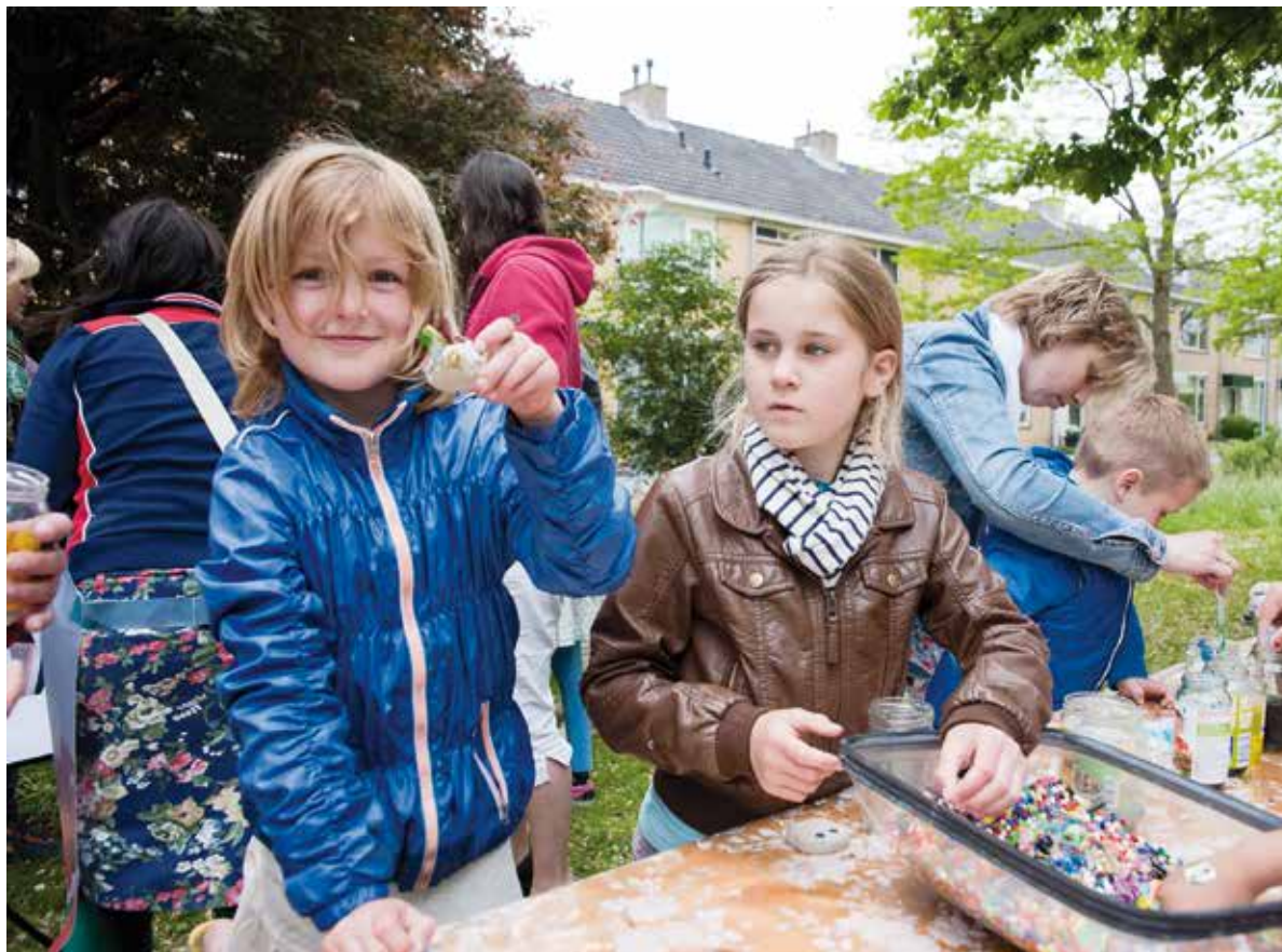
Kinderen in Graan voor Visch hebben donkere fietstunnels opgepimpt met 'spunks'.

Geen ijs, maar toch volop ijspret in Getsewoud tijdens de kerstvakantie. Op initiatief van de wijkraad werd hier een mooie kunststof ijsbaan aangelegd. Vrijwilligers hielden toezicht en dankzij een deal met de horeca in het winkelcentrum werd voorzien in koek en zopie. Door reclame aan te brengen van plaatselijke ondernemers kon de toegangsprijs laag blijven zodat zoveel mogelijk mensen van de ijsbaan konden genieten. Ten slotte kreeg Burgerveen een pluktuin en een wandelpad in en rond het dorp: een idee dat was voortgekomen uit de 'opendorpsplein-bijeenkomsten' georganiseerd door de dorpsraad. Tijdens deze bijeenkomsten kunnen bewoners initiatieven inbrengen om de leefbaarheid van het dorp te verbeteren.