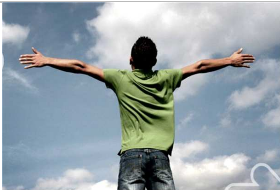
Ruimte voor de professional