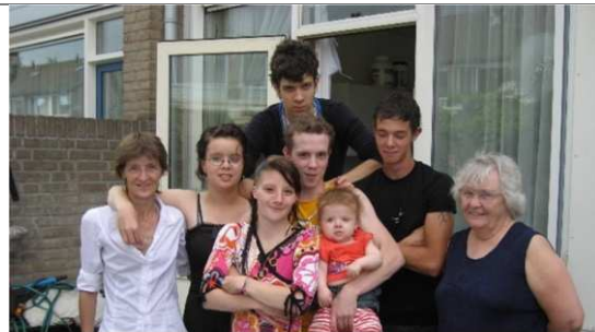
Eigen kracht en verantwoordelijkheid

Participatie, zelfstandigheid en eigen regie Zelf verantwoordelijkheid dragen Preventie Zp kort mogelijke afhankelijkheid van de overheid Wegnemen prikkels die zorgvraag in stand houden Vangnet voor kwetsbare mensen Terugdringen bureaucratische last Basisniveau aan voorzieningen en ook ruimte voor individueel maatwerk