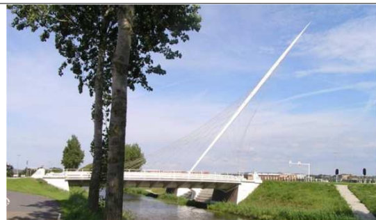
Ontschotter toegang en organisatie

Regelingen en domeinen zijn niet leidend Eén verantwoordelijke overheid en één budget Inwoner staat centraal Eén huishouden, één plan, één aanspreekpunt