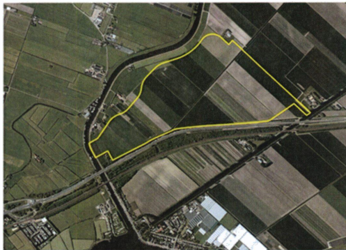
Globale begrenzing plangebied bestemmingsplan 'Buitengebied Zuid waterpiekberging'

Wij stellen het ontwerpbestemmingsplan met deze nota vast. We leggen de stukken vervolgens ter visie. Dan heeft een ieder gedurende zes weken de gelegenheid zienswijzen in te dienen.