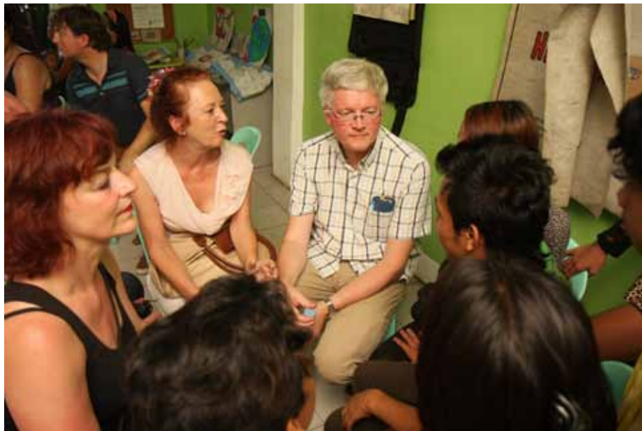
Delegatieleden in gesprek met jongeren die deelnemen aan het RESCUE-project

dat het moeite kost hen uit dit vreselijke bestaan te halen. Om die reden is er een ouderprogramma dat zich richt op de gehele gezinssituatie van de kinderen.