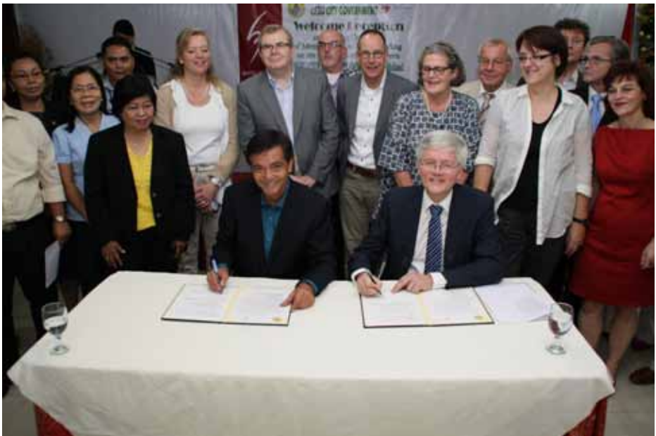
Ondertekening van het Memorandum of Understanding, in bijzijn van de delegatie en vertegenwoordigers van RAFI