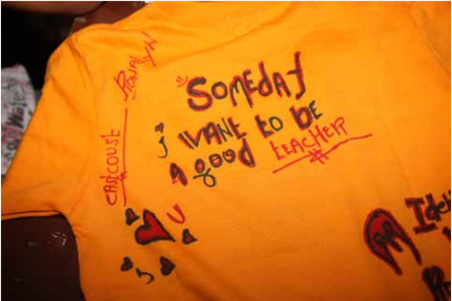
Wens van een deelnemer aan het RESCUE-project