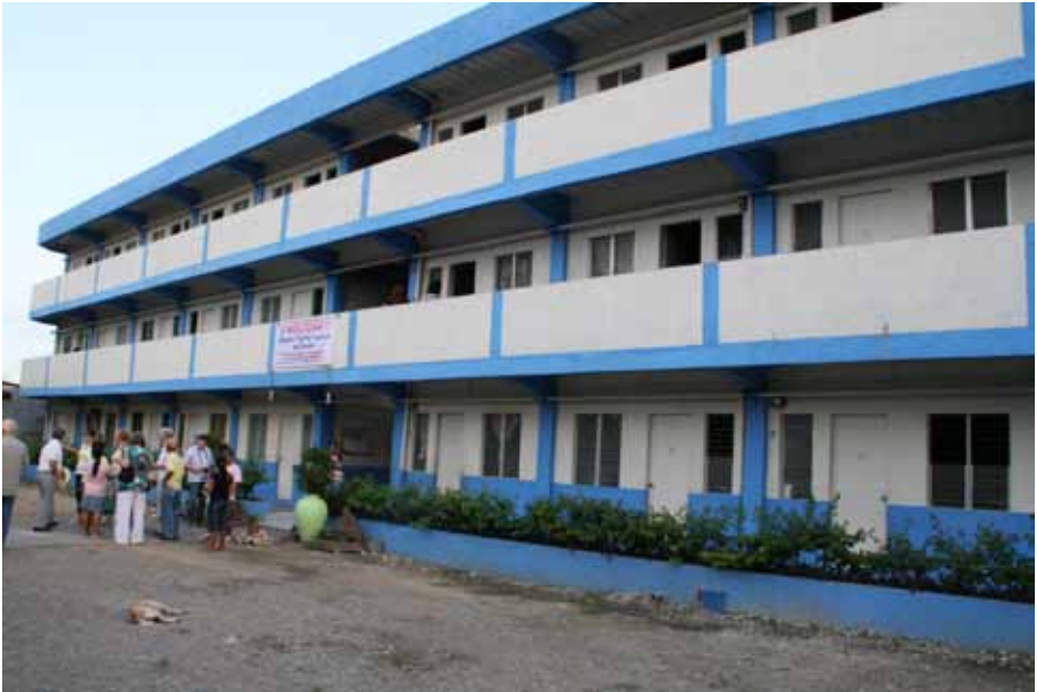
Nieuwe huizen voor de kerkhofbewoners, die naast de begraafplaats verrijzen

onderwijsvoorziening te ontwikkelen, dan zal VHC, gebaseerd op lessen uit het verleden, aan RAFI het verzoek doen om na te gaan wat de haalbaarheid en levensvatbaarheid van deze onderwijsvoorziening zal zijn. De kerkhofkinderen verdienen immers beter en indien mogelijk zal VHC daar een bijdrage aan leveren.