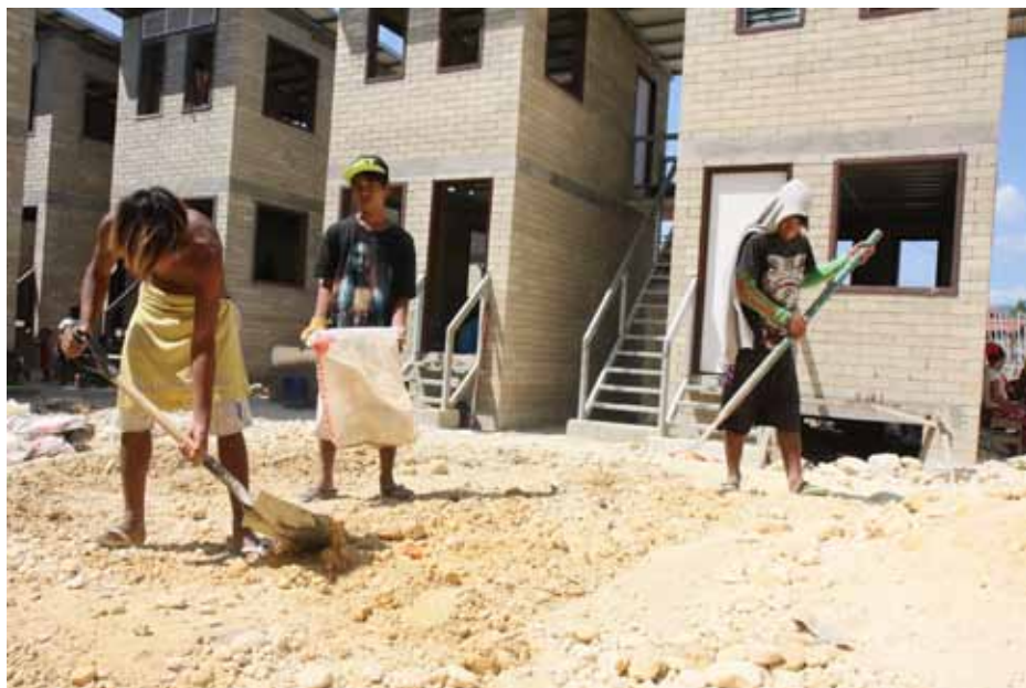
Badjau aan het werk bij hun nieuwe woningen

van boten die voor de visserij gebruikt kunnen worden. Op die manier kunnen de Badjau werken aan hun eigen levensonderhoud én ontwikkeling.