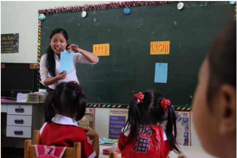
Kinderen krijgen les in het Wonderland Learning Center

Van het Core Drops project reden we door naar de Wonderland Learning Center in Tisa. Dit was voor een deel van de delegatie wederom een weerzien van oude bekenden. Op dit schooltje krijgen circa vijftig kinderen onderwijs en wordt een groep van ongeveer vijftien baby's opgevangen. De organisatie die achter de school zit, richt zich niet alleen op de kinderen maar ook op de ouders. Ze organiseren activiteiten om ouders bij de school te betrekken en leggen huisbezoeken af. Ook is er een voedingsproject, waarbij moeders in 'mama's-kitchen' op school eten voor de kinderen klaarmaken. Om dit initiatief te ondersteunen liet VHC ter plekke een cheque achter, waarmee de keuken kan worden ingericht met een koelkast, een fornuis en keukengerei. We lieten daarmee ook een zichtbaar ontroerde groep onderwijzers achter.