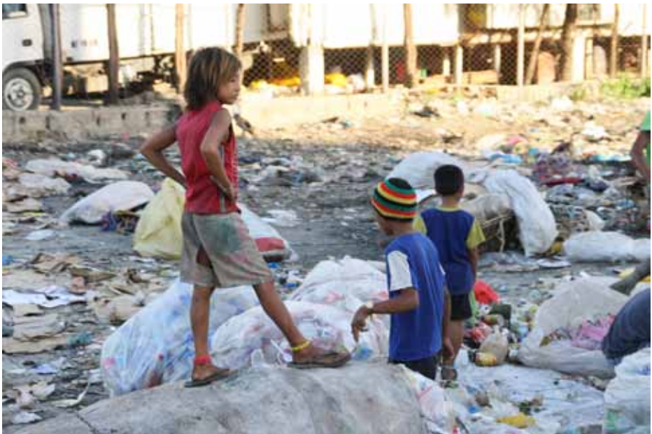
Kinderen bij de vuilnisbelt

Een korte rit nabij de vuilnisbelt waar - soms hele jonge - kinderen bezig waren om met blote handen het afval te sorteren, zorgde voor een veelzeggende stilte in de bus.