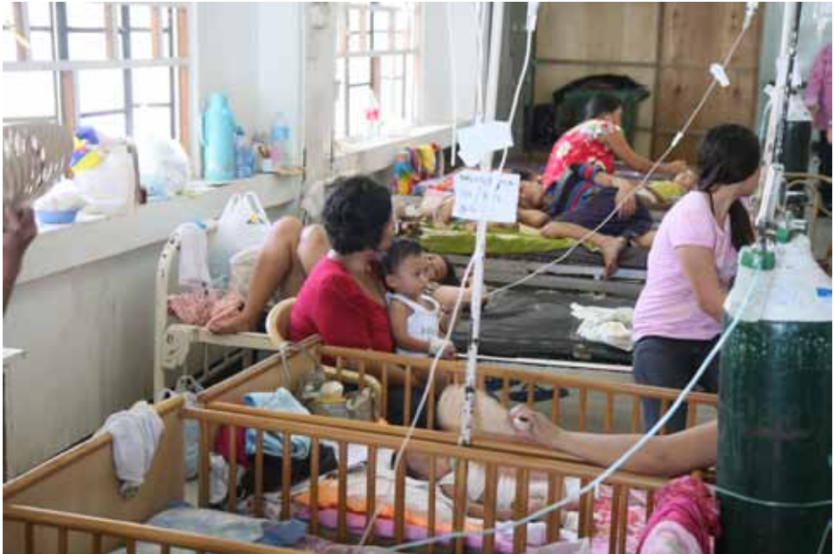
Kinderafdeling in het Cebu City Medical Center