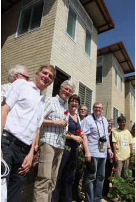
Delegatieleden voor de huizen die voor en door de Badjau zijn gebouwd

RAFI ontwikkelt een fantastisch project bij de Badjau. VHC heeft in het kader van haar 20-jarig bestaan in overleg met RAFI een flinke bijdrage geleverd met het laten bouwen van een multipurpose center: het Dik Trom Center. Daarnaast hebben de Nederlandse jongeren van MyCebu, een uitwisselingsprogramma met Cebuaanse jongeren, dankzij de bijdrage van de gemeente Haarlemmermeer meegeholpen aan het bouwen van twee units huizen. De stenen voor het bouwen van deze huizen worden door de bewoners van de Badjau zelf gefabriceerd. Zodra het project af is, is het de bedoeling dat de fabricage van deze stenen wordt voortgezet en dat ze worden verkocht aan andere barangay's (wijken) die zodoende ook zelf huizen kunnen bouwen.