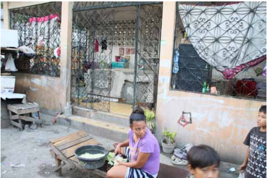
Woning in een grafombe op de Katholieke begraafplaats