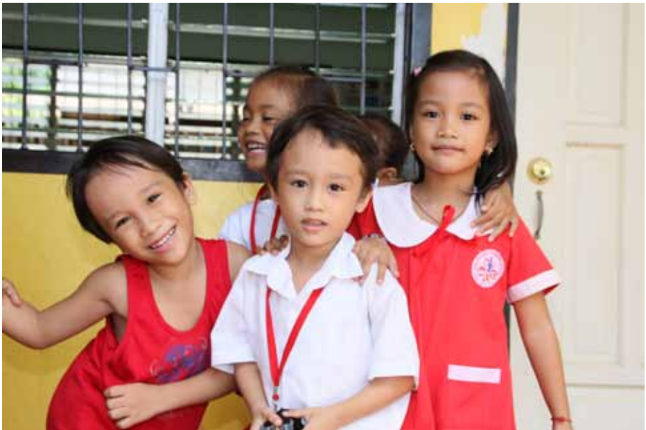
Kinderen in het Wonderland Learning Center

Het bouwen van WLC is eigenlijk een voorbeeld van hoe wij in de toekomst niet meer willen werken. Dankzij een donatie van een anonieme gever is destijds een school gebouwd in de wijk Tisa. Er is van te voren onvoldoende geïnventariseerd en nagedacht of in de wijk Tisa wel behoefte was aan een nieuwe school. Tijdens het overleg met RAFI hebben we geconstateerd dat er eigenlijk eerst een businessplan ontwikkeld had moeten worden voordat werd overgegaan tot het neerzetten van een nieuw gebouw. In 2013 zal overleg plaatsvinden tussen het bestuur van WLC, RAFI en VHC hoe de toekomst van WLC eruit moet komen te zien. Het is noodzakelijk dat er een businessplan komt waarin de ontwikkeling naar zelfstandigheid van WLC wordt vastgelegd.