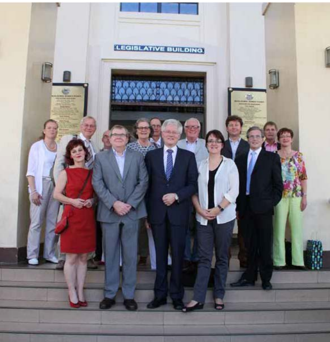
De Haarlemmermeerse delegatie voor het gemeentehuis van Cebu City