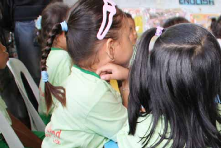
Kinderen krijgen les in de Arnold Jansen school

Voor de komende drie jaar heeft VHC zich de volgende vijf doelen gesteld: