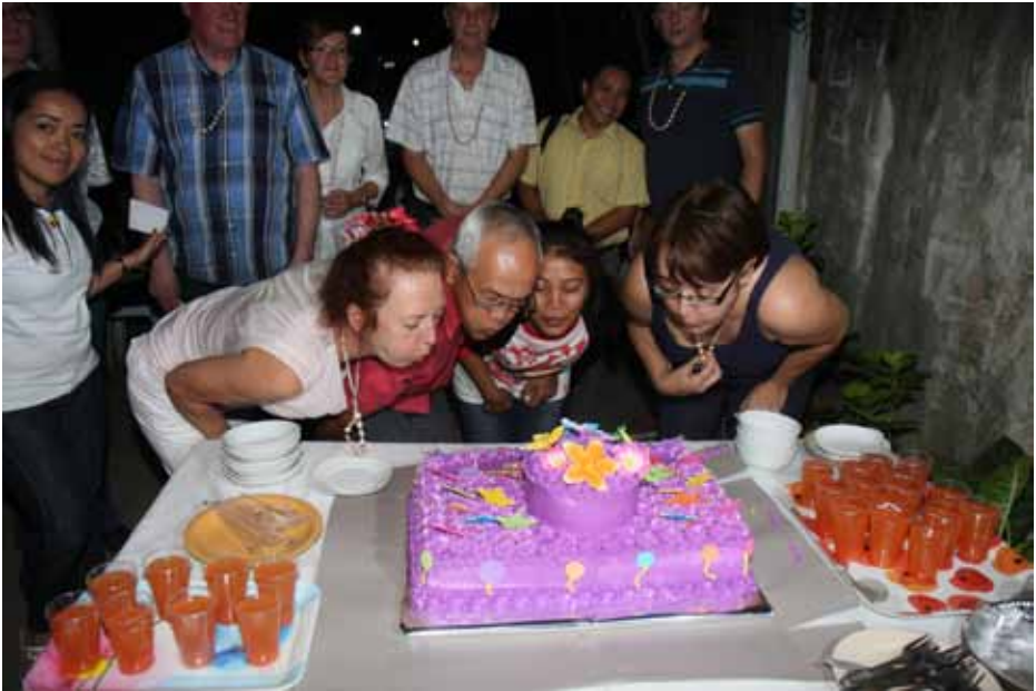
Taart ter viering van de samenwerking tussen Terre des Hommes, Forge en VHC

Sinds 2006 heeft Forge 2350 kinderen proberen te helpen. Ongeveer 1400 daarvan zijn seksueel geëxploiteerd. Circa 450 daarvan zijn door Forge uit de prostitutie gehaald. Resultaten die hoopvol zijn, maar ook laten zien hoeveel inspanning het vergt om op dit terrein iets te bereiken.