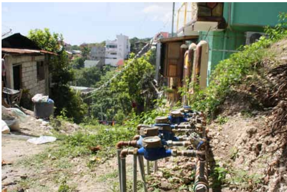
Waterleidingen en -meters in het heuvelachtige Tisa