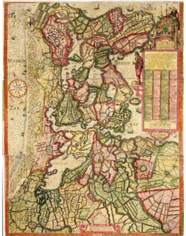
Provinciale Atlas: Landkaart en waterkaart van Noord-Holland en Westfriesland en de omliggende gebieden, Joost Jansz., 1608.

Op grond van de Mediawet financieren wij de regionale omroep RTV Noord-Holland . De provincie financiert de regionale omroep vanuit middelen uit het Provinciefonds, maar heeft geen zeggenschap over de exploitatie en de programmering. Hoewel de omroep belangrijk is als medium voor Noord-Hollandse culturele instellingen, is het voor ons niet mogelijk om inhoudelijk te sturen. De financiering draagt daarom niet bij aan het realiseren van onze doelen. Om deze reden is de omroep apart in de begroting opgenomen. In 2013 loopt de huidige concessie af en zal het Commissariaat voor de media op basis van advies van de provincie opnieuw een concessie verlenen. (UVP)