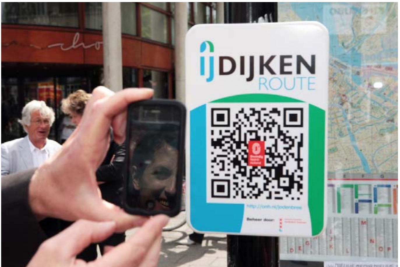
De QR code verwijst naar een verhaal in de IJdijken route, onderdeel van Oneindig Noord-Holland.

op locatie brengt het verhaal van het gebied tot leven. Wij willen de komende jaren culturele publieksprojecten nadrukkelijker koppelen aan provinciale opgaven. De Karavaan zal bijvoorbeeld in de komende jaren langs de kust trekken, gekoppeld aan het regionale project Identiteit Kustplaatsen (onderdeel Strategische Agenda Kust). (UVP)