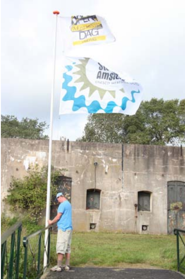
De Stelling van Amsterdam.