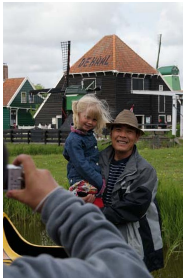
Toeristen op de Zaanse Schans.

Gebieden worden gekenmerkt door bijzondere landschappen en kenmerkend erfgoed. Door deze landschappelijke en cultuurhistorische kwaliteiten als uitgangspunt te nemen voor je toeristisch product, wordt meer samenhang in het toeristisch aanbod aangebracht. Het concept van regionale beeldverhalen is hiervoor zeer geschikt. In deze gebiedsgerichte aanpak brengen ondernemers, instellingen en overheden de identiteit van een gebied in kaart. Die identiteit bestaat uit een verzameling van bijvoorbeeld tradities, landschappelijke elementen en geschiedenis die een bepaalde regio uniek maakt. Alle betrokken partijen investeren vervolgens vanuit hun eigen rol in projecten binnen een gezamenlijk opgesteld programma: van investeringen in het landschap tot het maken van aantrekkelijke toeristische arrangementen. Dit draagt bij aan de versterking van de identiteit van een gebied en zorgt ervoor dat het toeristische aanbod, maar ook de voorzieningen beter op elkaar worden afgestemd. Een mooi voorbeeld van een Noord-Hollands Beeldverhaal is de Westfriese Omringdijk , waar de identiteit van het gebied gekoppeld is aan de beleving, evenementen en nieuwe media om het gebied te