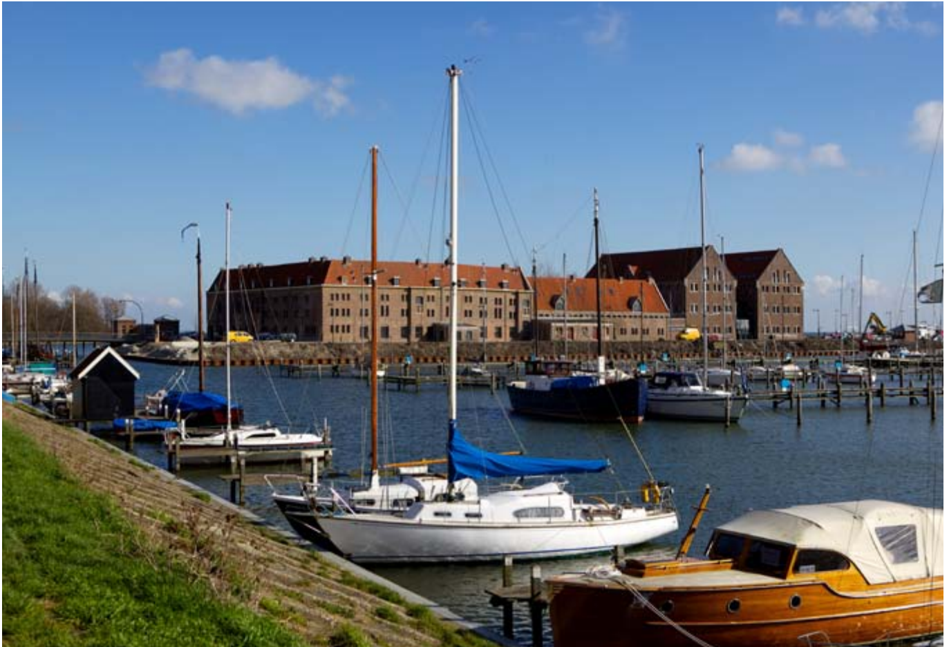
Herbestemde gevangenis Oostereiland in Hoorn.

van kennis en het opstarten van eigen trajecten stimuleert. Op deze manier willen wij jaarlijks drie herbestemmingsprojecten faciliteren. Waar we investeringen in monumenten kunnen combineren met onze herbestemmingprojecten, gaan wij dit doen. We verwachten dat de creatieve industrie een belangrijke rol kan spelen bij het bedenken van innovatieve oplossingen. ( UVP )