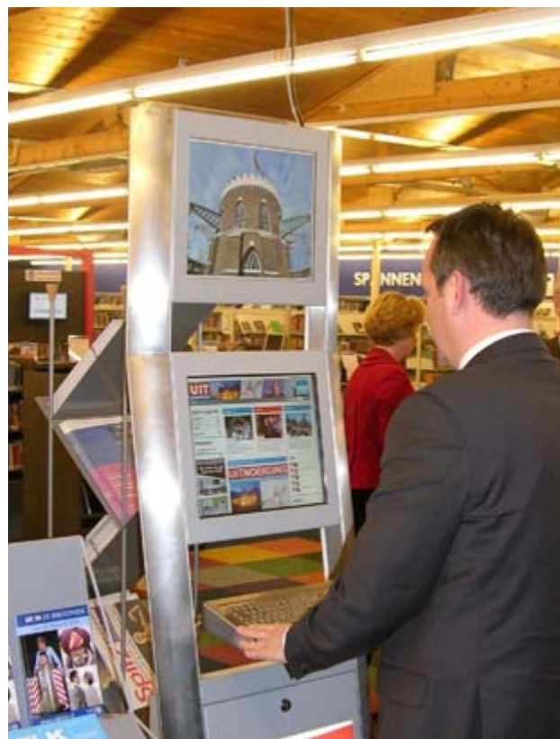
Uitpunt in bibliotheek Haarlemmermeer.

Cultuureducatie is een belangrijk onderdeel van het onderwijs op scholen in Noord-Holland. Onder cultuureducatie verstaan wij erfgoededucatie, kunsteducatie en media-educatie. De afgelopen jaren hebben wij vooral ingezet op het versterken van de kennis en kunde van scholen op het gebied van cultuureducatie om ervoor te zorgen dat zij duurzame samenwerkingsrelaties kunnen aangaan met hun culturele omgeving. Inmiddels hebben de meeste scholen voor primair onderwijs een beleid voor cultuureducatie. In de afgelopen jaren hebben wij daarom de verantwoordelijkheid voor de organisatie van culturele activiteiten op school overgedragen naar lokaal en regionaal niveau. Scholen en cultuuraanbieders zijn verantwoordelijk voor de organisatie van culturele activiteiten op school, waar nodig met ondersteuning van gemeenten. Scholen ontvangen hiervoor structureel € 10,90 per leerling van het Rijk. Op een aantal plekken,