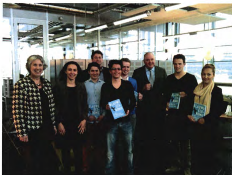
Studenten Economie en Management bezoeken MKB