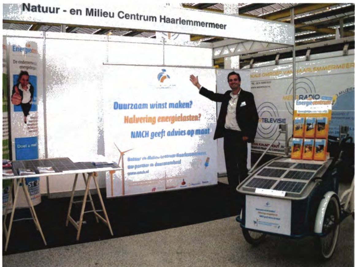
Stand op Bedrijvenbeurs Expo Haarlemmermeer