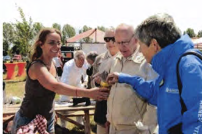
Lokale agrarische producten op Groene Loper Festival