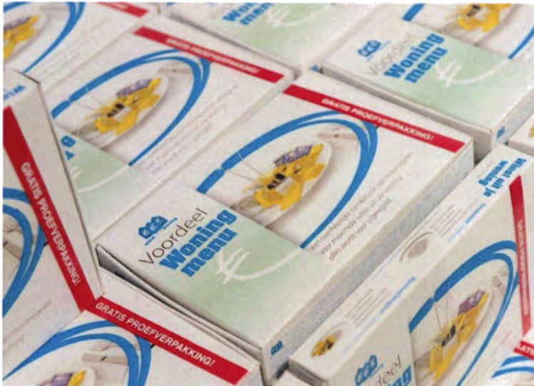
NMCH legt energieactie in de schappen van Albert Heijn