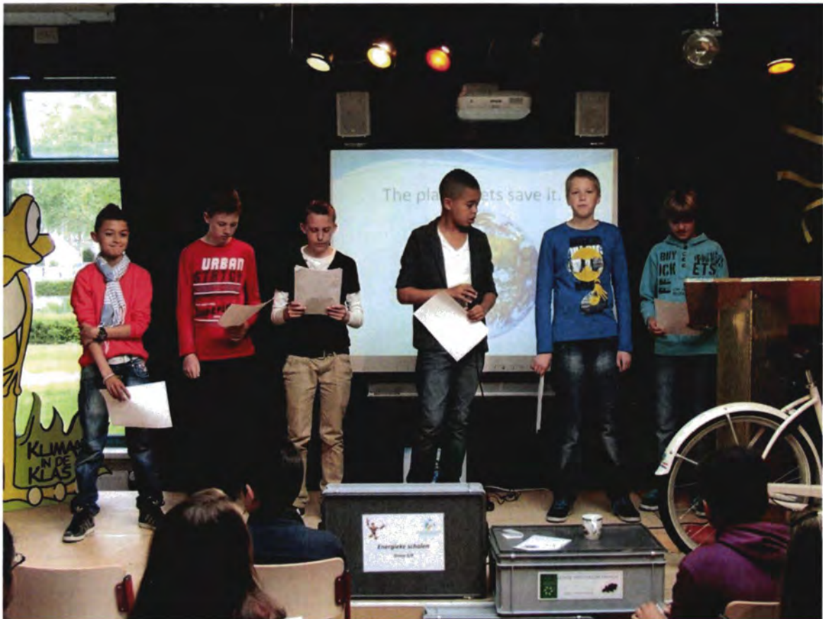
Presentatie Tips en Tops energie en klimaat