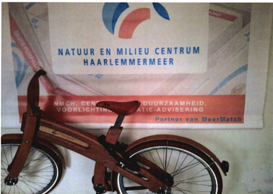
Banner: Partner van MeerMatch