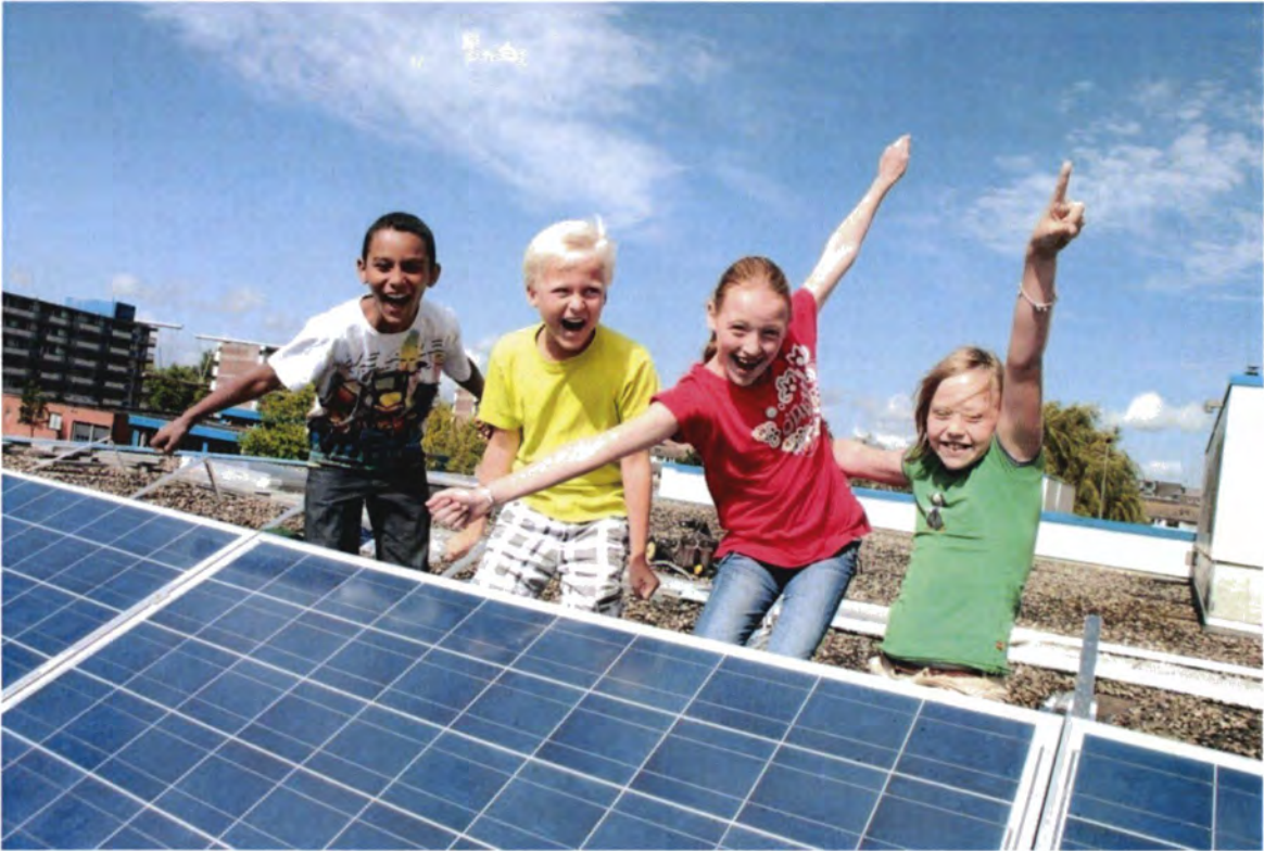
Zonnepanelen op schoolgebouwen, samenwerking tussen gemeente, scholen, bedrijven en NMCH