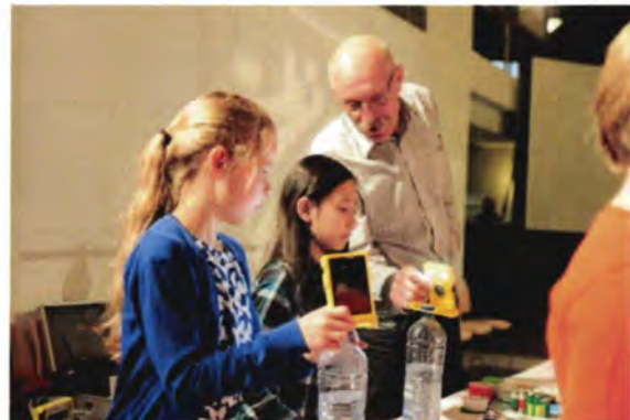
Project Energiebesparing op school

Wetenschappelijk onderzoek geeft steeds meer aanwijzingen dat de toename van welvaartziekten onder kinderen samenhangt met de toenemende verwijdering tussen kinderen en natuur. Het IVN heeft een factsheet samengesteld met een overzicht van de belangrijkste onderzoek resultaten naar het grote belang van natuur voor de psychische en lichamelijke ontwikkeling en de gezondheid van kinderen. (jan 2013: jeugd, natuur en gezondheid, Groen doet goed )