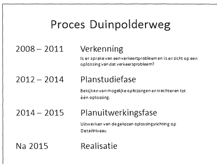
Afbeelding 1: Planning besluitvorming Duinpolderweg

Eén van de speerpunten uit het Collegeprogramma 2010-2014 en het Deltaplan Bereikbaarheid is de aanleg van de regionale wegverbinding N206-A4, tegenwoordig genaamd Duinpolderweg. Voor de realisatie van de Duinpolderweg (N206-A4) loopt momenteel een besluitvormingsproces onder leiding van de Provincie Noord-Holland. De besluitvorming bevindt zich momenteel in de planstudiefase (zie afbeelding 1).