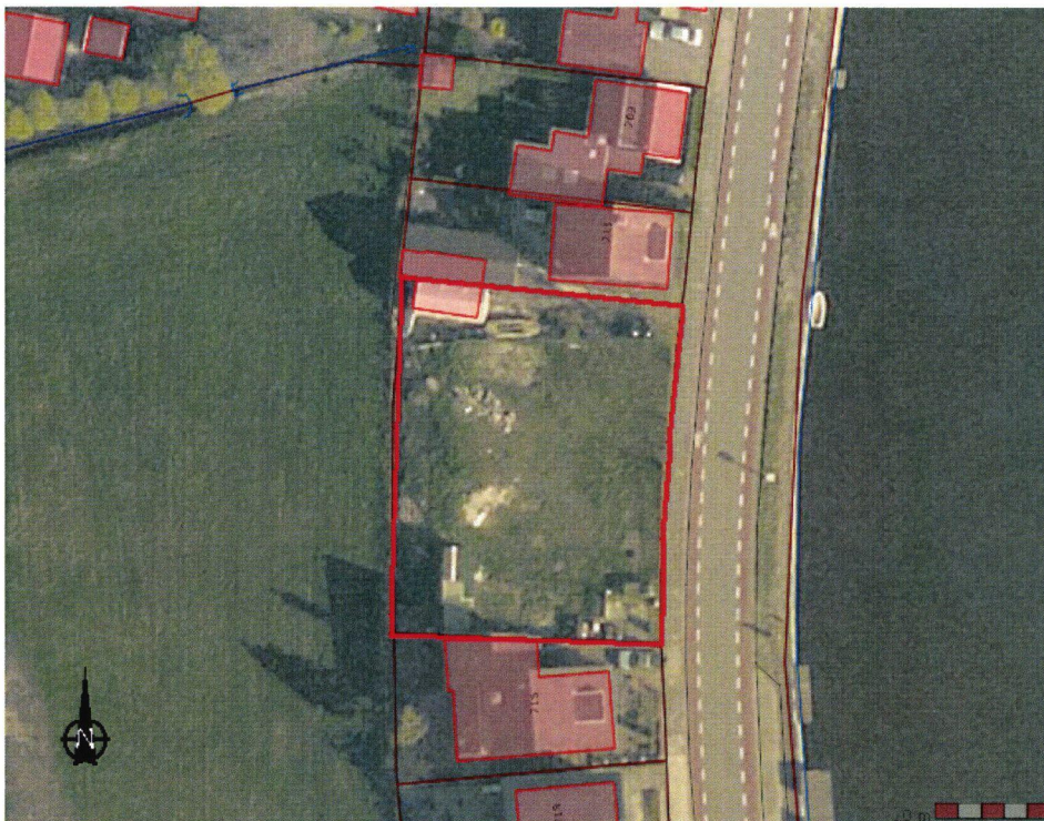
Figuur 1 begrenzing plangebied

Het plangebied heeft betrekking op het perceel Lijnderdijk tussen 211 - 216, kadastraal bekend als sectie AA, nummer 00257. In het noorden en zuiden grenst het plangebied aan een van oudsher bestaand woonlint. Ten oosten van het plangebied liggen de openbare weg (Lijnderdijk) en de Ringvaart. Ten westen van het perceel ligt agrarisch gebied (weiland).