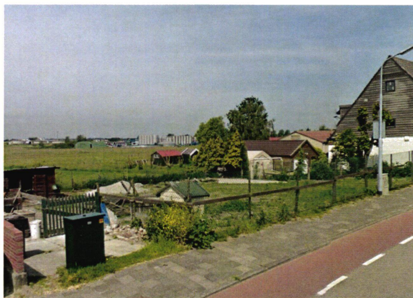
Figuur 2 vooraanzicht perceel

Tussen de woningen zijn kleine doorzichten naar het achtergelegen landschap. Door het schuin aflopen van de dijk zijn veel woningen uitgevoerd met een souterrain. De ruimte tussen de woningen wordt vaak gebruikt voor parkeren of als ontsluiting voor het souterrain aan de achterzijde. Een klein deel van de bewoners van de woningen parkeert langs de Ringvaart.